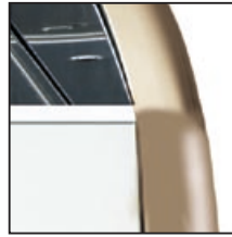
Sabbia Sand Arena Sable Sand 沙色