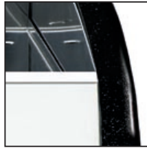
Nero metallizzato Metallic black Negro metalizado Noir métallisé Schwarz metallisiert 金属黑