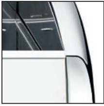
Cromato Chromed Cromado Chromé Chromiert 铬色