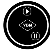
2 buttons keypad Pulsantiera a 2 pulsanti