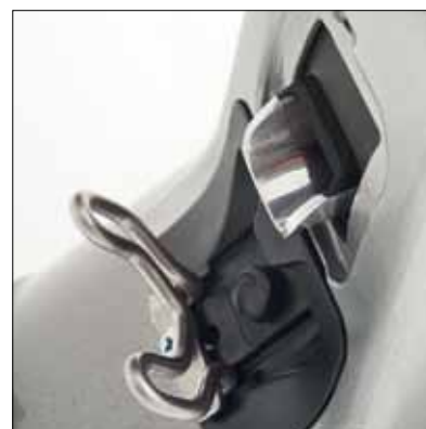
Convogliatore del caffè regolabile Adjustable canal for coffee output