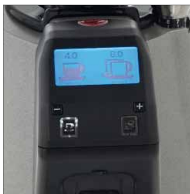
Comandi semplificati Operator oriented