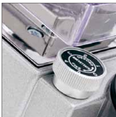
Pomello di regolazione micrometrica Eureka Innovative micrometric regulation

The micrometric adjustment of grinding thickness with rotor blade axial slide enables the best possible grinding. Its instant dosing ensures the best quality and aroma. Mignon instant grinder is a fundamental partner to all baristas that wish to satisfy their customers needs with decaffeinated or "gourmet" coffee. Notwithstanding its dimensions, Mignon Istantaneo guarantees the same grinding quality and many other features as all other Eureka professional grinders. These relevant features make Mignon the perfect instant grinder to offer to your customers an alternative to the traditional blend.