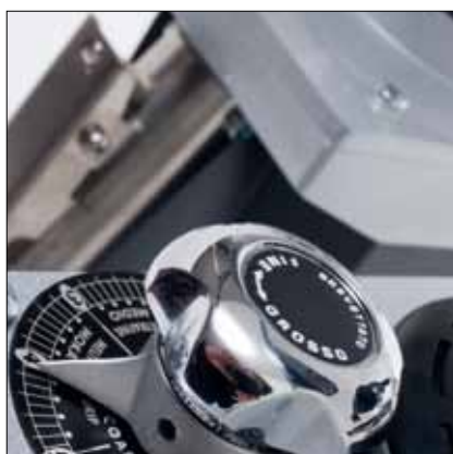
Regolazione micrometrica rapida Rapid micrometric adjustment