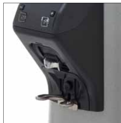
Forcella portafiltro Fork filter holder