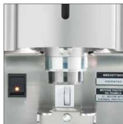
Pressatura differenziata Variable pressing coffee