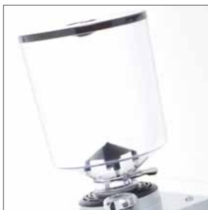
Campana caffè in grani Bean hopper