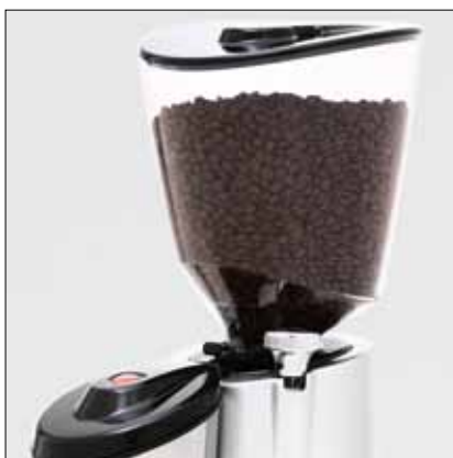
Nuova campana ad alta capacità New high capacity hopper