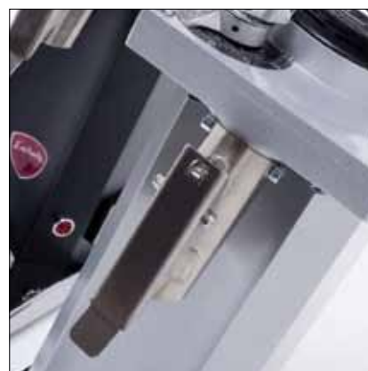
Bocchettone con reggisacchetto Pipe with bag support