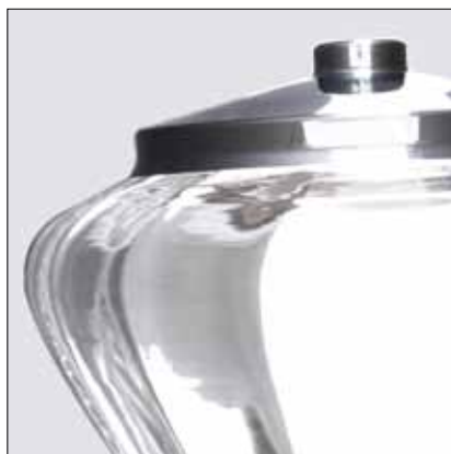
Campana in vetro lavorata a mano Hand made glass hopper