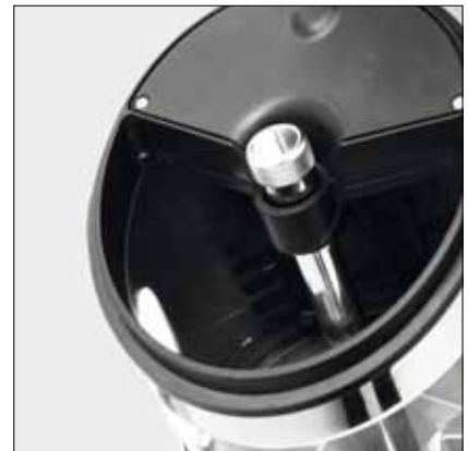
Pomello regolazione dose Dose adjustment knob