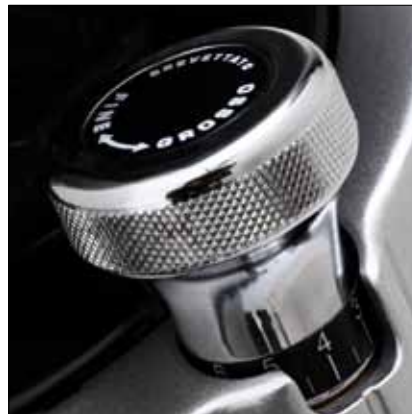
Regolazione micrometrica della macinatura Knob for the micrometric grinding adjustment