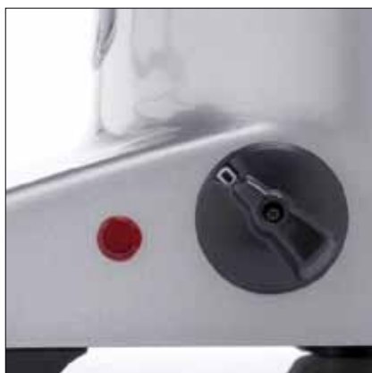
Interruttore generale Main Switch