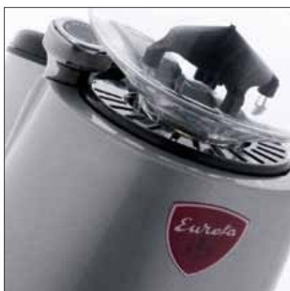
Regolazione micrometrica della macinatura Knob for the micrometric grinding adjustment