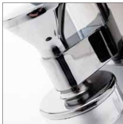
Pressino intercambiabile in alluminio Interchangeable coffee tamper in aluminium