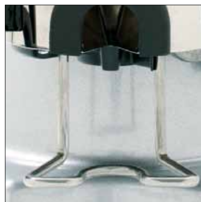
Zenith+Rotax®= affidabilità, precisione e pulizia Zenith+Rotax®=Reliability, precision and cleanness