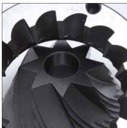
Macine coniche Conical burrs