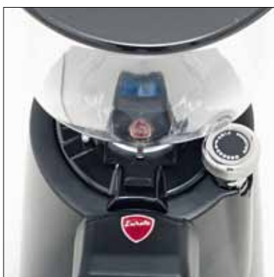
Regolazione micrometrica della macinatura Micrometric grinding adjustment