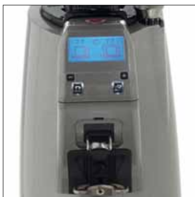
Sistema di supporto portafiltra in fase di macinatura Support system for filter holder