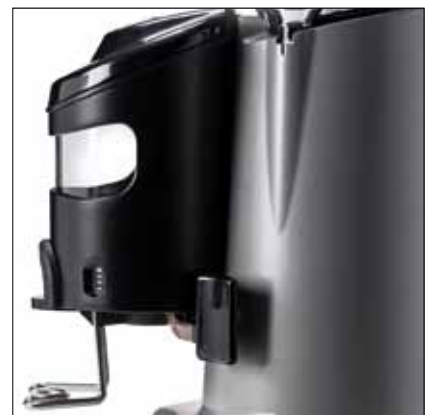
Zenith+Rotax®= affidabilità, precisione e pulizia Zenith+Rotax®=Reliability, precision and cleanness