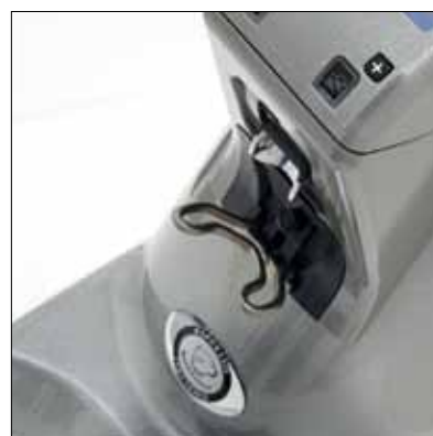
Corpo in alluminio Alluminium body