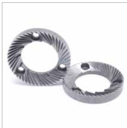
Macine piane Flat burrs