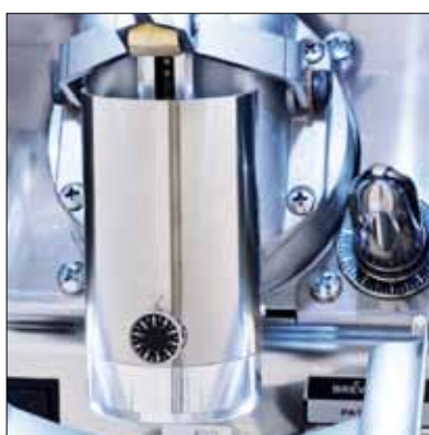
Regolazione della macinatura e pressatura Grinding adjustment and pressing