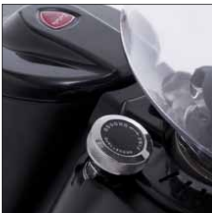
Pomello di regolazione micrometrica Eureka Eureka micrometric regulation knob