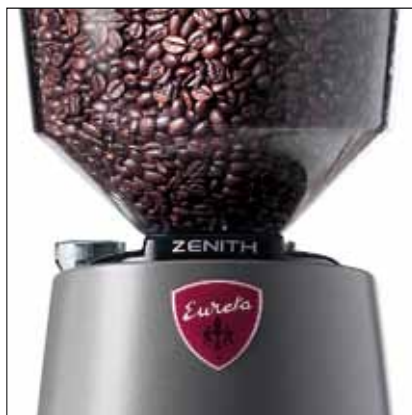
Dosatore Rotax® e gestione della dose Rotax® doser and dose handling