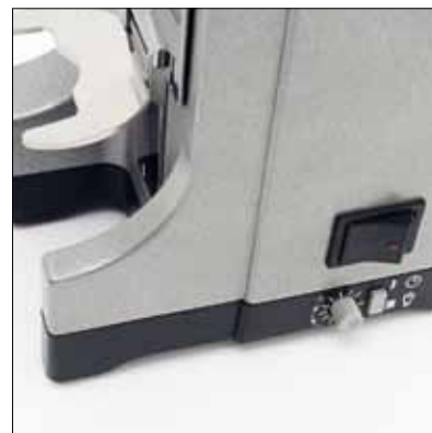
Manopola regolazione dose Dose adjustment knob