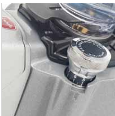
Pomello di regolazione micrometrica Eureka Knob micrometric regulation