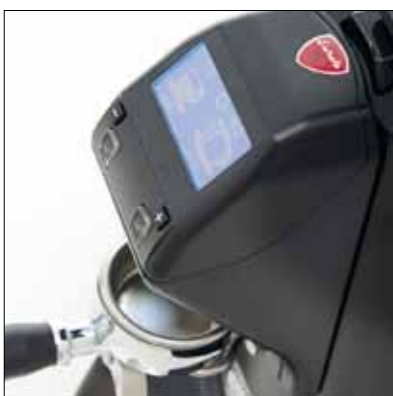
Display retroilluminato Backlit display