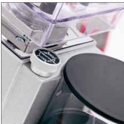
Pomello di regolazione micrometrica Micrometric adjustment knob