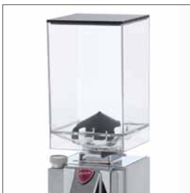
Campana trasparente da 0,50 Kg Transparent bean hopper (0,50 Kg)