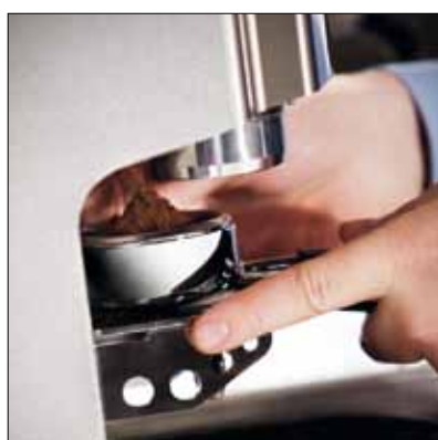
Dosatura perfetta Perfect dosing