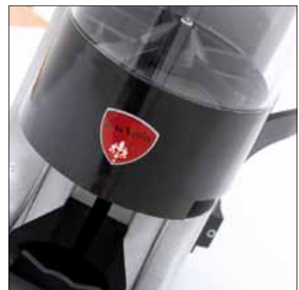
Dosatore manuale Manual doser