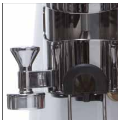
Pressino intercambiabile in alluminio Interchangeable coffee tamper in aluminium