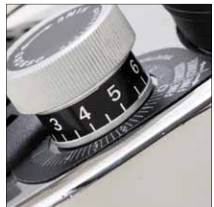
Registro per la regolazione della macinatura Register for fineness adjustment grinding