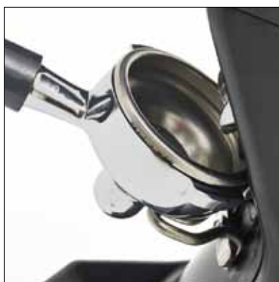
Reggifiltro bloccante Blocking filter holder