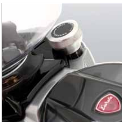
Pomello di regolazione micrometrica Eureka Eureka micrometric regulation knob