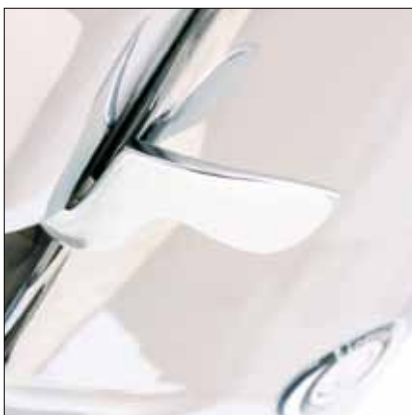
Dosatore in alluminio con contadosi Aluminium doser with counter