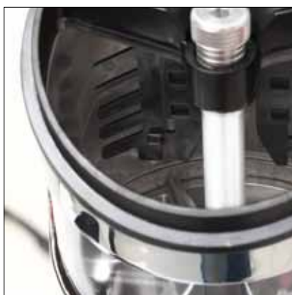
Dosatore Rotax® e gestione della dose Rotax® doser and dose handling